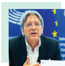
Guy Verhofstadt, diputado al Parlamento Europeo

Este órgano trino cuenta con el apoyo de un comité ejecutivo , copresidido por las tres instituciones: