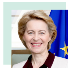
Ursula von der Leyen, Presidenta de la Comisión Europea