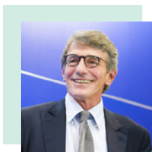
David Sassoli, Presidente del Parlamento Europeo

La Conferencia está bajo la autoridad de las tres instituciones, representadas por