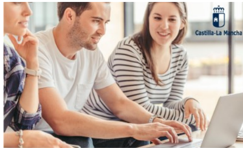
Becas de especialistas en Asuntos Europeos

El pasado 26 de mayo se publicó en el Diario Oficial de la Junta de Comunidades de Castilla-La Mancha, la nueva convocatoria de becas para la formación de especialistas en asuntos relacionados con la Unión Europea que concede el Gobierno de Castilla-La Mancha. Anualmente se conceden 3 becas remuneradas, que se completan de forma presencial en la sede de la Dirección General de Asuntos Europeos en Toledo durante ocho meses y en la Oficina de la Junta de Comunidades de Castilla-La Mancha en Bruselas, durante cuatro meses.