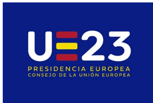
Logo de la presidencia española del Consejo de la Unión Europea

El día 1 de julio de 2023 marcaba el comienzo de la Presidencia española, que finalizará el día 31 de diciembre del mismo año. Durante este semestre, la Presidencia española tiene como objetivo mejorar la vida de todos los europeos, para lo que se vale de cuatro prioridades para conseguirlo: impulsar la reindustrialización de Europa y garantizar la Autonomía Estratégica Abierta, avanzar hacia la transición ecológica y la adaptación ambiental, consolidar el pilar social y reforzar la unidad europea.